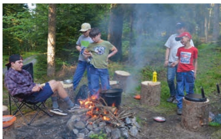
Gemütliche Zeiten am Lagerfeuer.