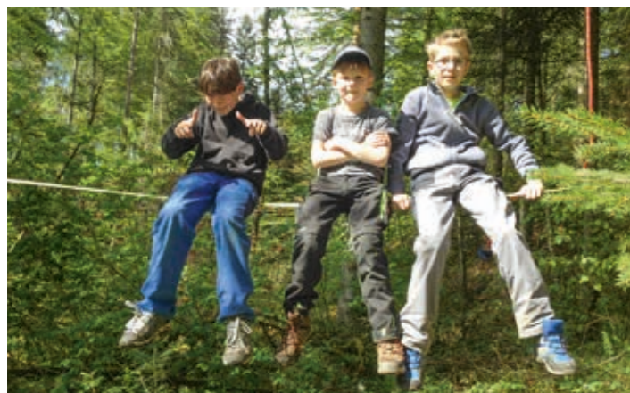
«Las la bambala» auf der Seilbrücke.